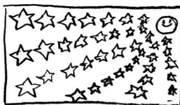
右上におく 大きさを考える